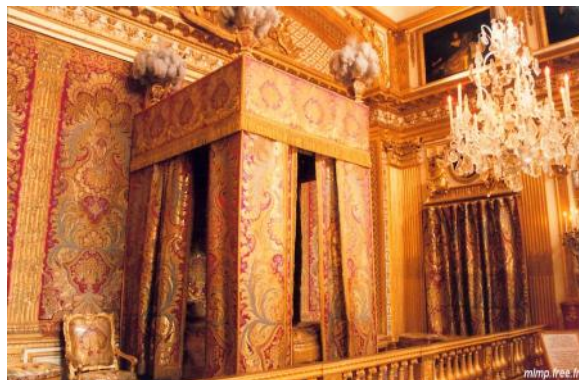
La chambre du roi