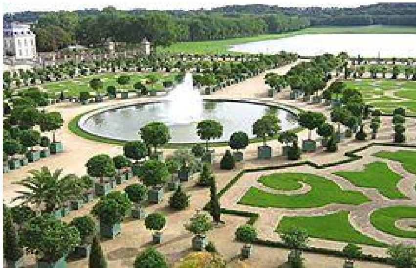
L'orangerie du château de Versailles

Le jardin à la française est un jardin à ambition esthétique et symbolique. Il porte à son apogée l'art de corriger la nature pour y imposer la symétrie. Il exprime le désir d'exalter dans le végétal le triomphe de l'ordre sur le désordre, de la culture sur la nature sauvage, du réfléchi sur le spontané. Il culmine au XVII e siècle avec la création pour Louis XIV du jardin à la française bientôt copié par toutes les cours d'Europe