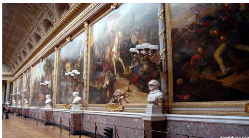
La galerie des batailles

Le château de Versailles possède également de merveilleux jardins, composés de fontaines, de bassins, de statues et en s'y promenant on peut découvrir d'autres châteaux plus petits comme: le petit et le grand Trianon, le hameau de la reine, une ménagerie et bien d'autres lieux.