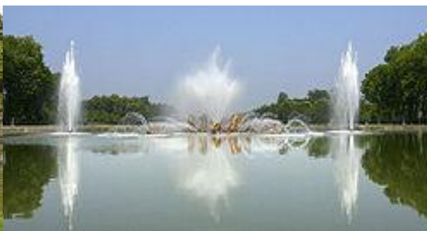
Le bassin d'Appollon

Le jardin de Versailles s'étale sur 67 000 mètres carrés, voici un de ses anciens plans.