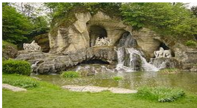
La grotte des bains d'Appollon avec les statues provenant de la grotte de Thétys

Le château de Versailles possède également de merveilleux jardins, composés de fontaines, de bassins, de statues et en s'y promenant on peut découvrir d'autres châteaux plus petits comme: le petit et le grand Trianon, le hameau de la reine, une ménagerie et bien d'autres lieux.