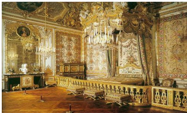
La chambre de la reine