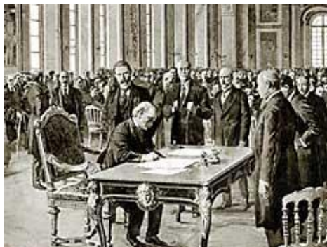
Signature du Traité du 28 juin 1919

Une autre anecdote, la galerie vit l'arrestation du grand aumônier de France et cardinal de Rohan, en 1785 avant sa mise à la Bastille (épilogue de l'affaire du collier de la reine).