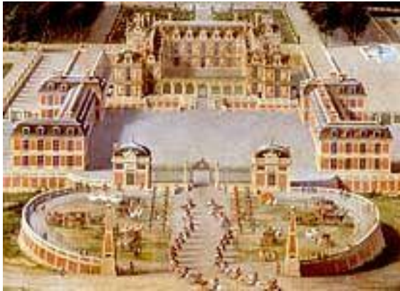
Versailles en 1623

Le Château de Versailles est situé au sud ouest de Paris dans la ville de... Versailles !