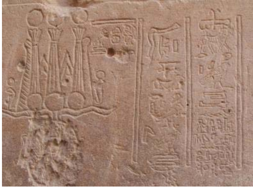
Inscription dans le temple de Philae

C' est une écriture à la fois figurative, symbolique et phonétique. Elle compte 750 signes . Créée en 3200 avant J-C elle fut employée pendant 3000 ans . La dernière inscription connue à ce jour, datée du 24 août 394, se trouve dans le temple de Philae.