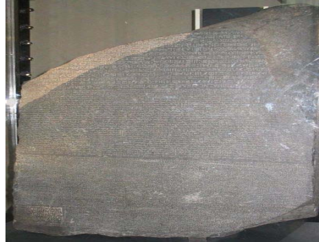
Pierre de Rosette

Le texte se lit de haut en bas, de droite à gauche. Pour découvrir le sens de lecture d'un texte, il suffit de considérer les êtres animés (animaux en particulier) qui regardent en direction du début du texte.