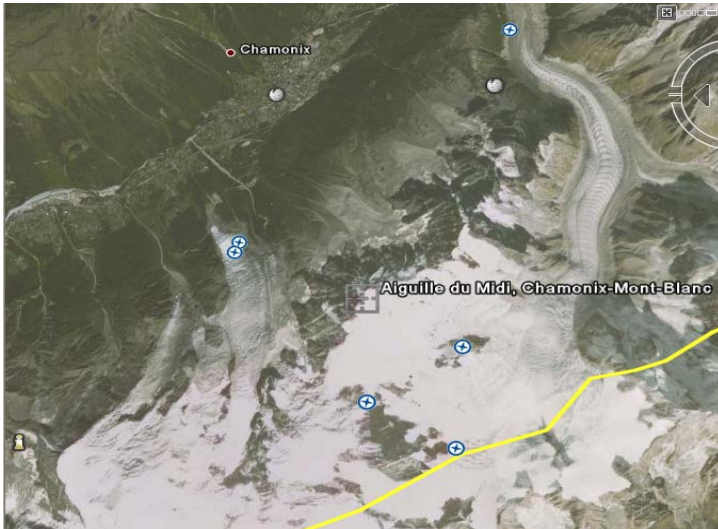
Vue du massif par satellite

L'aiguille du Midi doit probablement son nom à sa situation, au sud de Chamonix : vu depuis le centre-ville, le soleil passe au droit du sommet aux alentours de 12h.