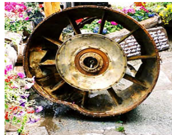
les restes de l'un des réacteurs du Boeing 707 d'Air India

Seize ans plus tard, Air India perd un second avion de ligne et paye un lourd tribut supplémentaire de 117 morts dans le secteur des rochers de la Tournette, non loin du sommet du Mont Blanc.