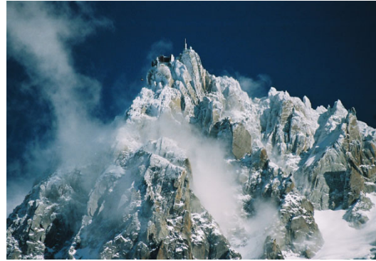
aiguille du midi

( Infos.mtblanc.net/tele/midi/index.html )