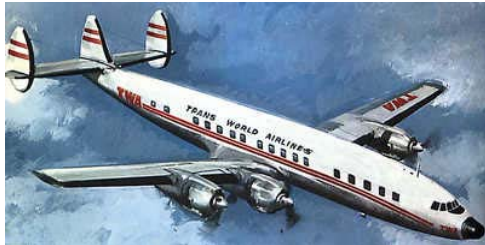
Le Malabar Princess

Le 3 novembre 1950 a lieu une première catastrophe aérienne civile dans le massif du Mont Blanc. Le Malabar Princess s'écrase tuant son équipage et ses quarante passagers.