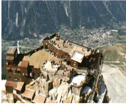
Plate forme de l'aiguille du midi

( Infos.mtblanc.net/tele/midi/index.html )