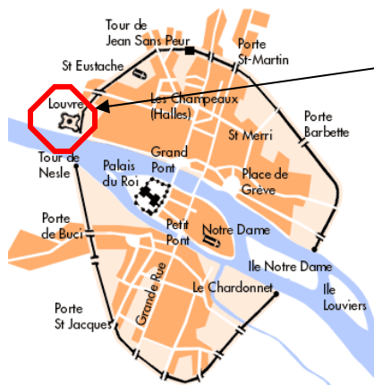
Musée du Louvre

Horaires d'ouvertures : Le musée est ouvert tous les jours de 9h à 18h sauf le mardi et les jours fériés. Le musée du Louvre est gratuit le premier dimanche de