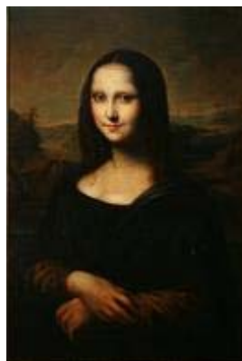
Voici le tableau de la Joconde