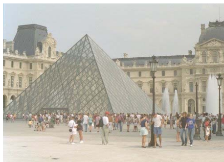
La grande pyramide de verre.

Depuis l'aéroport Charles de Gaulle : RER B direction Massy-Palaiseau, changer à Châtelet les Halles, prendre la ligne 14 direction saint-Lazare, descendre à Pyramides ou bien prendre la ligne 1 et descendre à Palais-Royal/musée du Louvre.