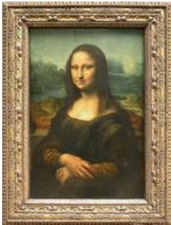
La Joconde, Huile sur bois (peuplier), H. : 77 cm. ; L. : 53 cm.

Ce portrait fut probablement peint à Florence entre 1503 et 1506. Il s'agirait du portrait de Lisa Gherardini, épouse de Francesco del Giocondo, marchand d'étoffes florentin, dont le nom féminisé lui valut le "surnom" de Gioconda, francisé en "Joconde". La Joconde ne fut sans doute pas livrée à son commanditaire. Il semble que Léonard l'ait emportée en France et que son élève et héritier Salai l'ait rapportée en Italie. Mais on ignore comment elle parvint dans la collection de François Ier.