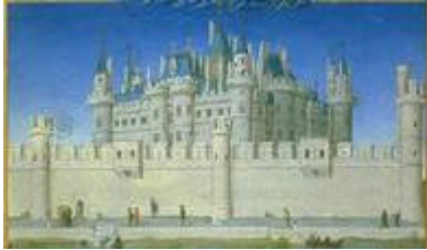
Château du Louvre vers 1200

La construction du château du Louvre a commencé sous le règne de Philippe Auguste à partir de 1190 pour protéger Paris des dangers Anglo-Normand. Le Château a évolué au cours des siècles pour devenir un musée. En 1793, après la Révolution, le Palais va devenir un Musée.