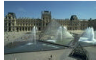
La pyramide du Louvre en 1989