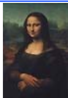
Léonard de Vinci (la Joconde)